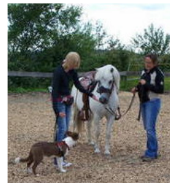
auf dem Pferdehof