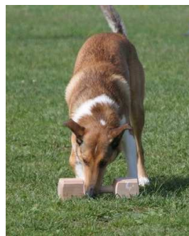
holen des Bringholzes