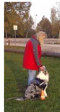
sitz an der Seitel

Individuelles Einzeltraining / oder Kleinstgruppe – maximal 4 TN - jeweils 1 Std.