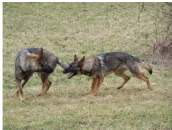
Freispiel: ja, aber in „Maßen“ ☺