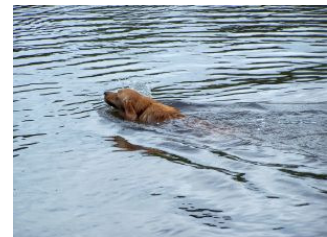
Neues lernen ?!?!